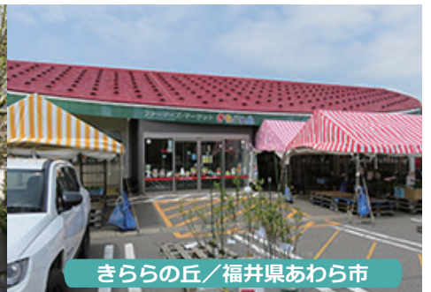
きららの丘 / 福井県あわら市