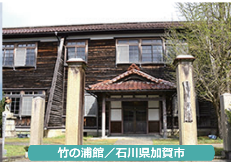
竹の浦館 / 石川県加賀市