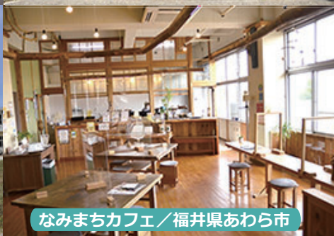
なみまちカフェ / 福井県あわら市