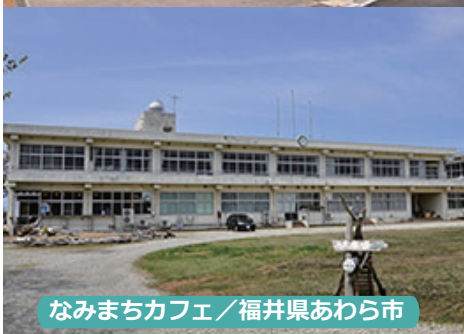
なみまちカフェ / 福井県あわら市