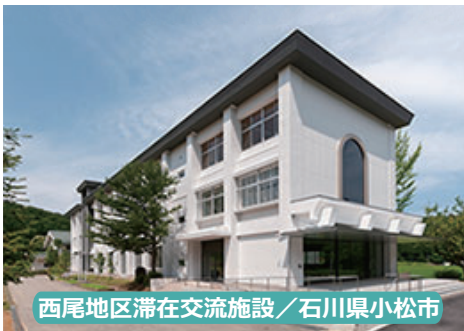
西尾地区滞在交流施設 / 石川県小松市