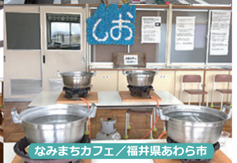
なみまちカフェ / 福井県あわら市