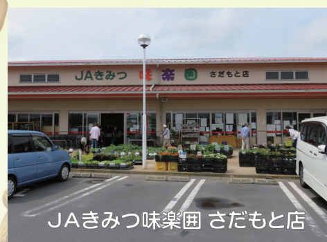
JAきみつ味楽園 さだもと店