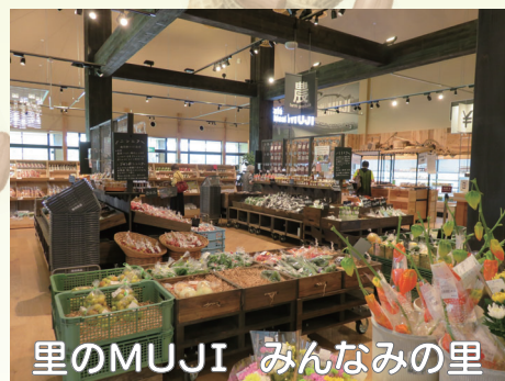
里のMUJI みんなみの里