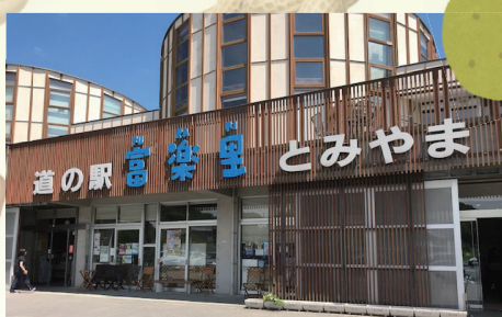
道の駅富楽里 とみやま