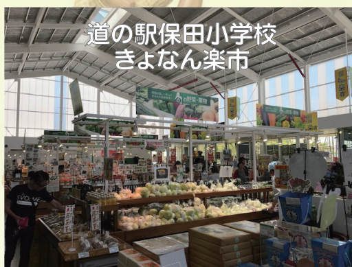
道の駅保田小学校 きよなん楽市