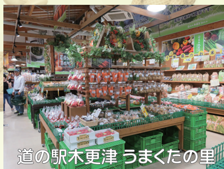
道の駅木更津 うまくたの里